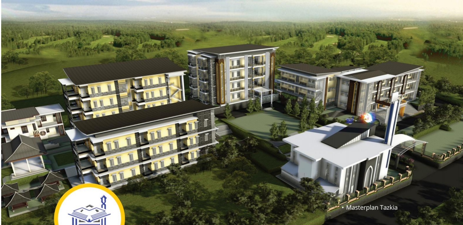
• Masterplan Tazkia