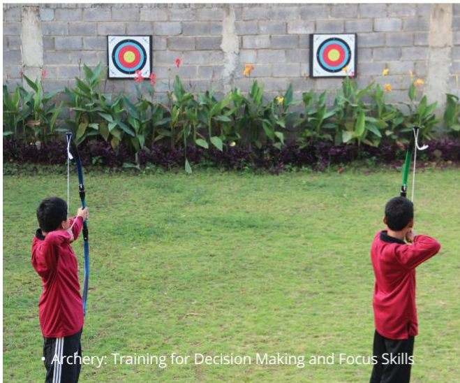
• Archery: Training for Decision Making and Focus Skills