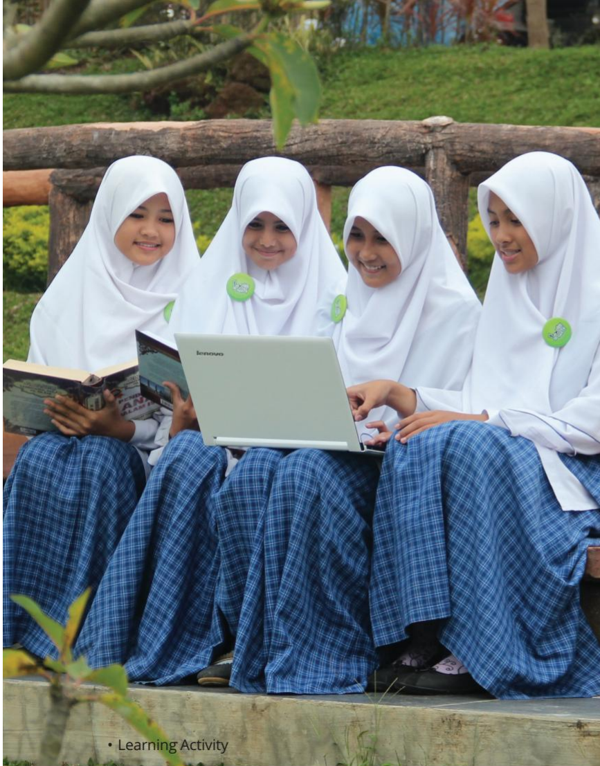
• Learning Activity