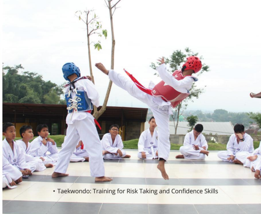
• Taekwondo: Training for Risk Taking and Confidence Skills