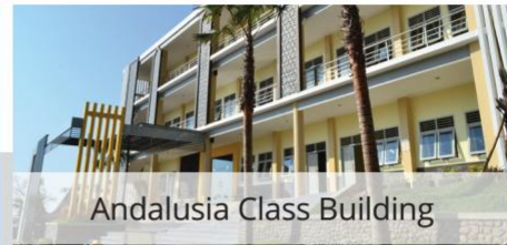
Andalusia Class Building

Kampus Tazkia menempati lahan seluas 10.000 M2 dengan lingkungan yang asri dan bangunan baru yang modern. Untuk siswa putri, fasilitas kelas, Lab Science, perpustakaan dan perkantoran terletak dalam gedung Andalusia dan Cambridge. Untuk asrama, Medical Center, Astronomy Lab, Hall dan tempat ibadah berada di gedung Alexandria yang di desain secara khusus sehingga memberikan kenyamanan bagi kegiatan santri dan murabbiyah. Untuk siswa putra, Tazkia menyediakan area dan fasilitas terpisah menyerupai oriental guest house dan asrama Al-Azhar dilengkapi dengan traditional cottage, pendopo, gazebo, sport arena dan natural lab.