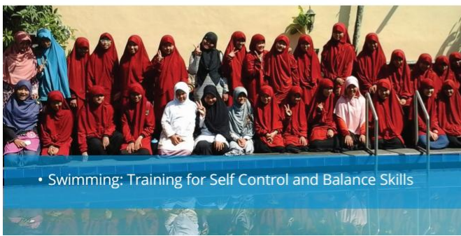
• Swimming: Training for Self Control and Balance Skills