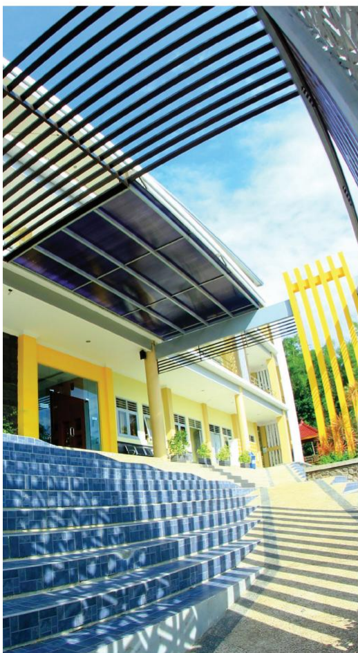
• Andalusia Class Building

TAZKIA INTERNATIONAL ISLAMIC BOARDING SCHOOL