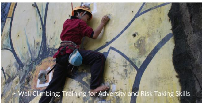
• Wall Climbing: Training for Adversity and Risk Taking Skills

Untuk membangun kesadaran terhadap kesehatan diri, lingkungan dan sosial, Tazkia juga menyelenggarakan berbagai program social services dan sport dengan program pilihan utama Swimming, Horse Riding, Memanah (Archery), Health Care, Wall Climbing, Taekwondo, Futsal dan Fundraising for Free Qur'anic Education Program and Scholarship.