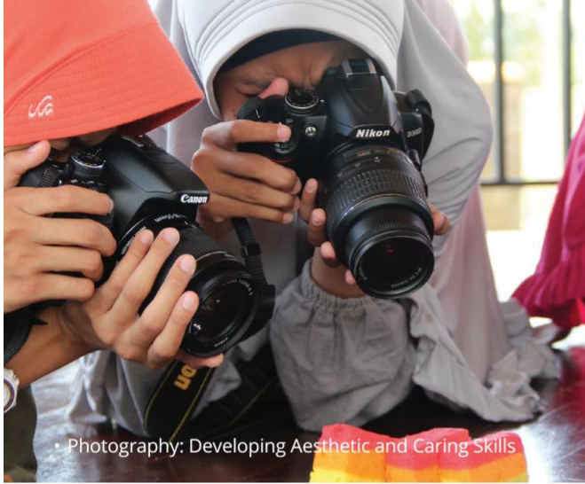
• Photography: Developing Aesthetic and Caring Skills